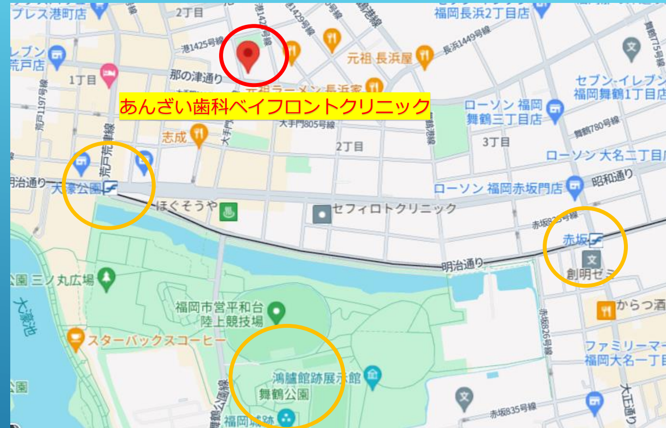
地下鉄最寄りは大濠公園駅です