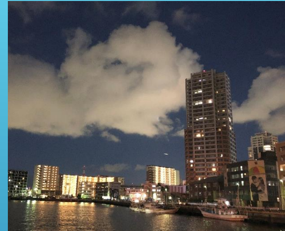
北側には博多港（かもめ広場）