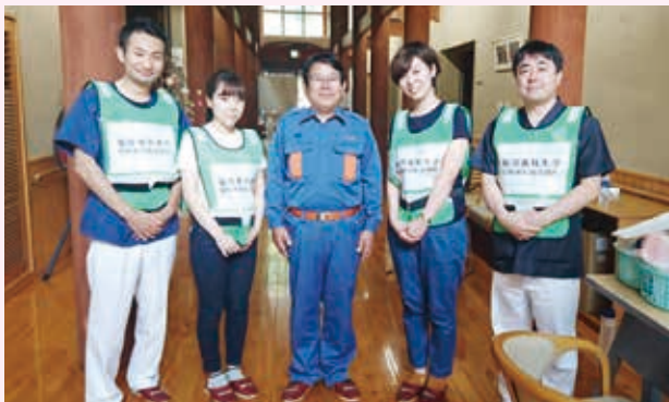
▲東峰村村長と ともに、心よりお見舞い申し上げます。

平成 29 年 7 月 5 から 6 日にかけて福岡県朝倉市、うきは市、東峰村、大分県日田市などを襲った九州北部豪雨が発生し、同地区に甚大な被害が生じたため、我々福岡歯科大学医科歯科総合病院は、福岡県歯科医師会・歯科衛生士会、九州大学病院、九州歯科大学と連携を取り、7 月 19 日から 23 日までの 5 日間に、